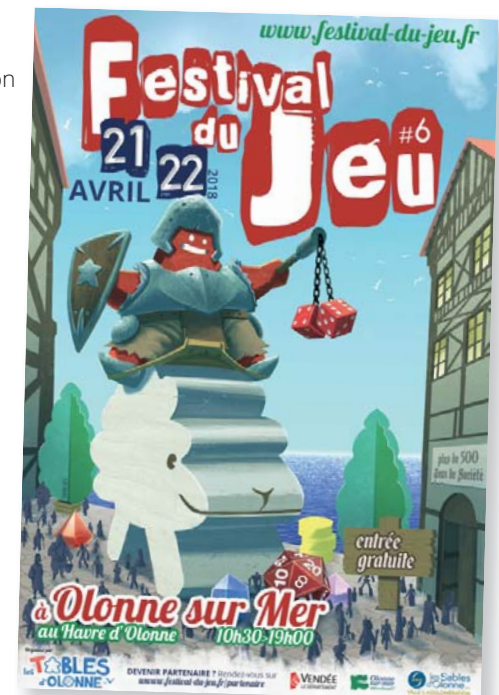
l'affiche de la 6 ème édition

Nous proposons à tous les âges de s'amuser, d'apprendre et d'échanger.